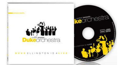
Grand prix 2009 Hot Club de France